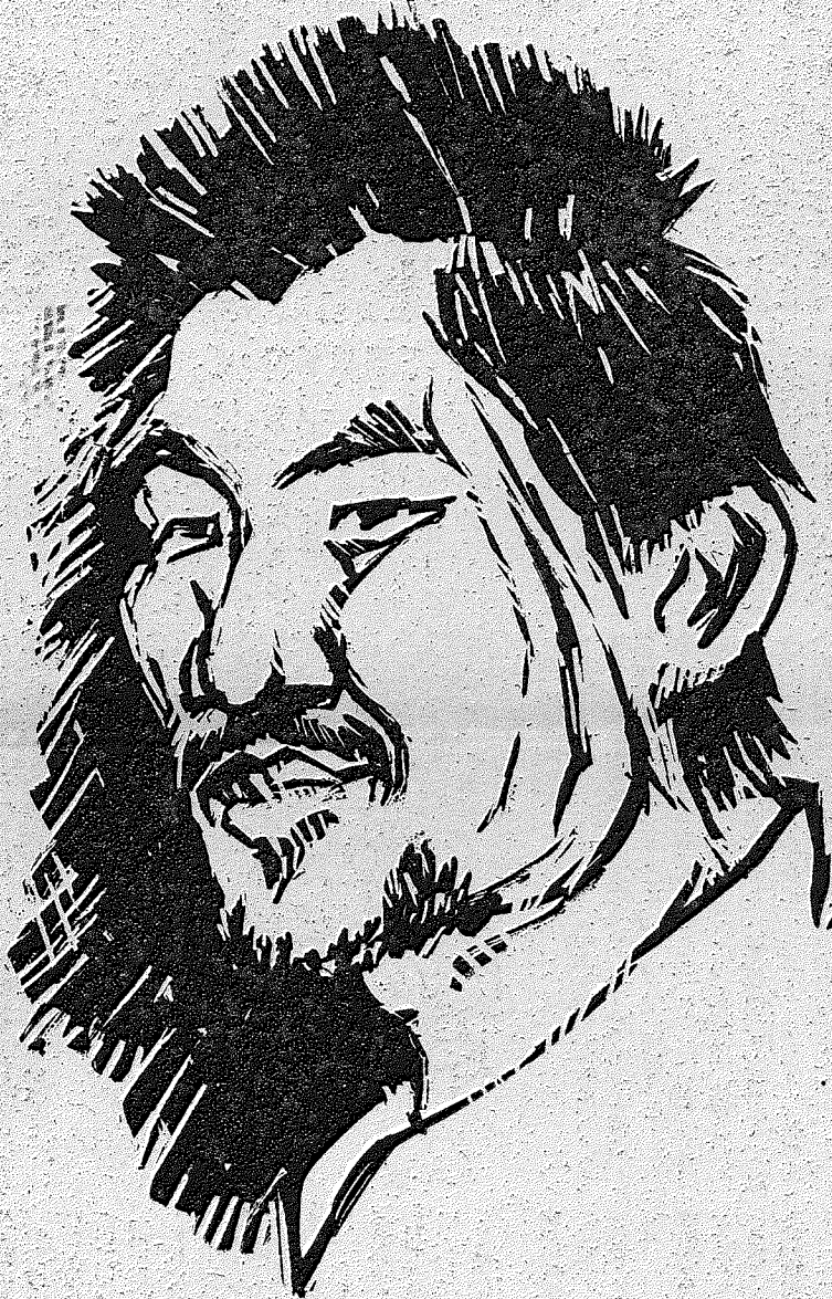
お兄さん、私はこの手紙を書きながら...